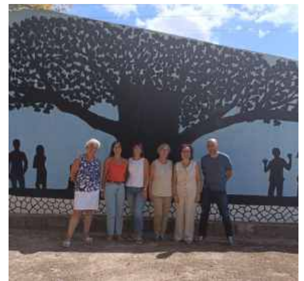
Equip Directiu i claustre del CMFPA Canals

Volem agrair també l'implicació de l'actual equip de govern i en concret de la Regidora d'Educació que sempre ha cregut en la Formació de Persones Adultes i del paper que este servei públic desenvolupa en un poble com Canals. Esta implicació és fonamental per garantir que la segona oportunitat que oferim a la població adulta d'actualitzar i millorar la seua educació no passe desapercibuda i siguem visibles en tots els àmbits de la societat del poble.